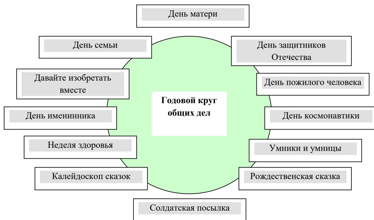
Рис. 1. Годовой круг общих дел МБДОУ № 70

Главной особенностью вышеперечисленных мероприятий является партнерская деятельность всех участников образовательного процесса. Основу этой деятельности составляет годовой круг общих дел (рис. 1)